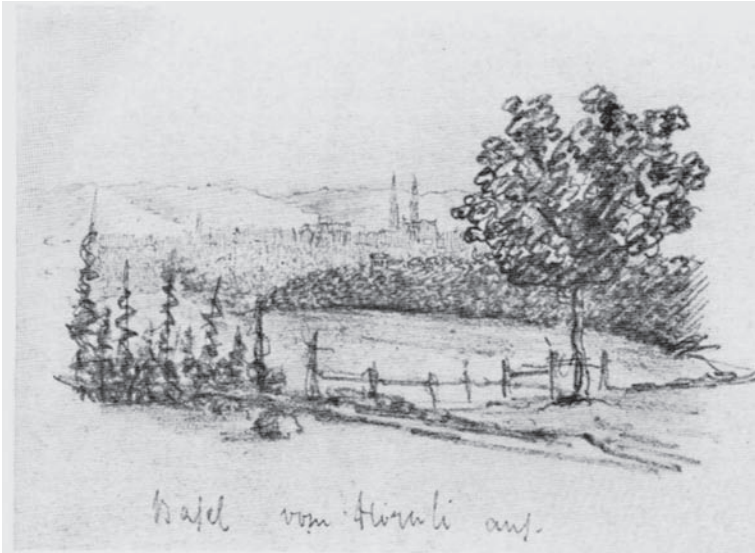
Jacob Burckhardt: Blick auf Basel vom Grenzacher Hörnli aus , Bleistiftskizze. In der Morgenfrühe des 19. Septembers 1839 nimmt Jacob Burckhardt Abschied von seiner Vaterstadt, reist er auf einem grossen Umweg durch Süddeutschland und Böhmen zum Geschichtsstudium nach Berlin. Vom Grenzacher Hörnli blickt er noch einmal zurück, zeichnet er auf dem ersten Blatt seines Reiseskizzenbuches die in der Morgenluft verdämmern den Münstertürme.